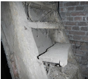
Vervuilde vloeren, trappen en ladders zijn een gevaar voor de veiligheid.