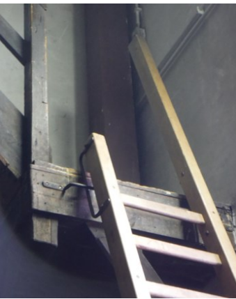
Ladderboom loopt door als handgreep om makkelijker te kunnen