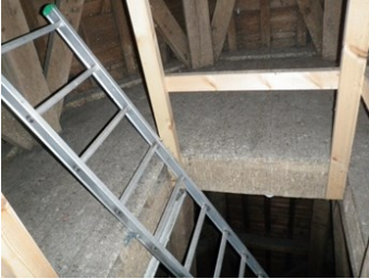
Een ladder die boven het bordes uitsteekt, maakt de overstap makkelijker. ①