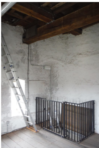
Een leuning rond of luik op het trapgat om valgevaar te voorkomen.③