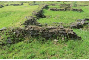
^ Opgegraven muurresten / archeologische ruïne