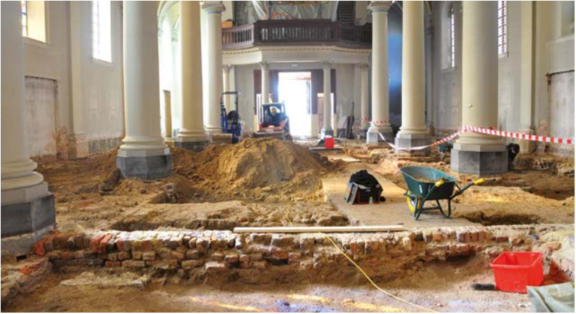
^ Opgraving in een kerk naar aanleiding aanleg vloerverwarming