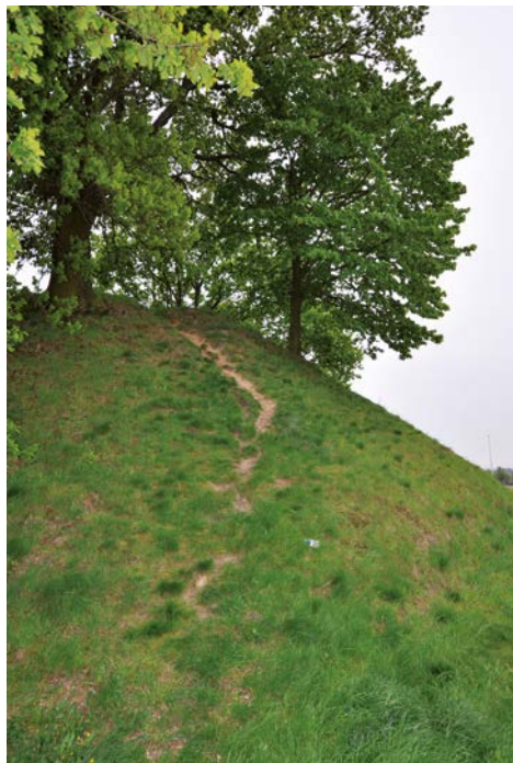
Betredingserosie op een tumulus >

Om het verval te stoppen en nieuwe aantastingen te voorkomen is een actief instandhoudingsbeheer van groot belang. Al met enkele eenvoudige ingrepen kan u een belangrijke bijdrage leveren aan de zorg voor dit erfgoed, zodat het ook voor toekomstige generaties bewaard kan blijven als bron van kennis en beleving.