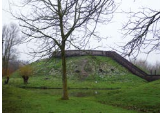
Gerestaureerde en ingerichte motte