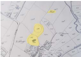
Typische 8-vorm op 19 de eeuwse kadasterkaart