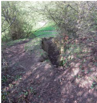
Erosiegeul door bmx en motorcross