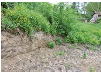
Bandeninsporing in voet motte