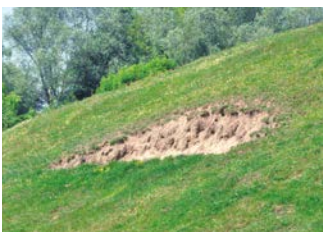
Erosie in helling motte door betreding dieren