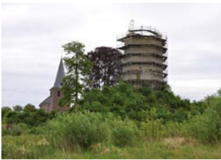
Motte met torenruïne