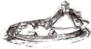
Het ideaalbeeld van een castrale motte