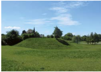
Motte in grasland