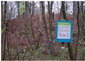
Motte in bos