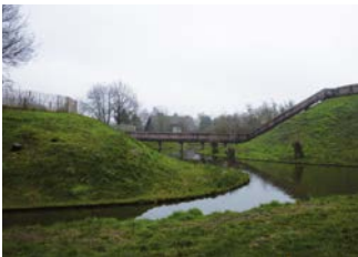
Gerestaureerde motte met opperhof (rechts) en neerhof (links)