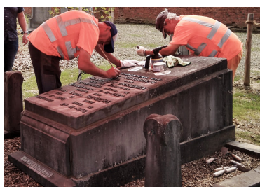
Bronzen letters worden voorzien van een nieuwe waslaag.

Indien het jaarlijks reinigen ontoereikend is voor de instandhouding van het oppervlak, kan het brons na reiniging nog beschermd worden met microkristallijne was (vb. Renaissance Wax). Breng deze dun en regelmatig aan in twee lagen op een warm voorwerp. Voor kleine objecten, die in je hand passen, gebruik je een warmteblazer (haardroger of verfblander) om het oppervlak waar de was zal worden aangebracht op te warmen en om de overtollige was te verwijderen. Grote objecten krijg je op deze manier nooit warm genoeg, hiervoor schakel je best een specialist in. Tussen de twee waslagen best eens opwrijven met een protere katoenen doek.