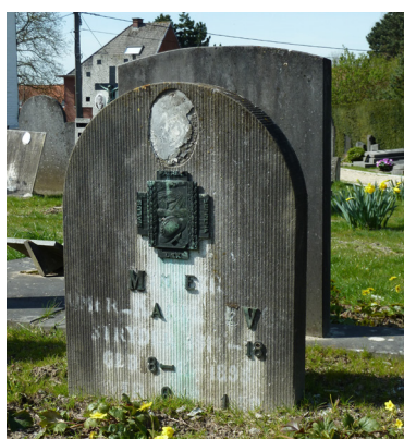
Een graf verliest een groot deel van zijn historische waarde door het verdwijnen van opschriften. Controleer of de letters nog goed vast zitten. Herbevestig de losse letters of bewaar ze op een veilige plaats in afwachting.

Registreer losgekomen letters of ornamenten en bewaar ze op een veilige plaats in afwachting van herbevestiging.