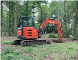
Tuin/parkaanlegwerken met ingreep in de bodem op een kasteeldomein