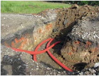
Een bodemingreep: het aanleggen van nutsleidingen