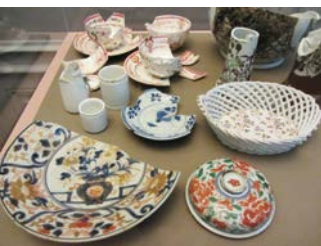
Vondstmateriaal aangetroffen bij de ruiming van kasteelgrachten/vijver