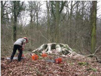
Kappen van bomen met behoud van de stronk