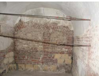
Bouwsporen in het muurwerk van een kasteelkelder