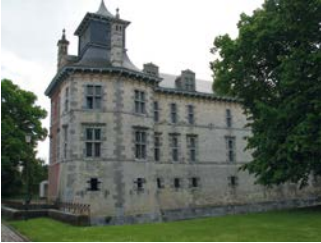
Een historisch gegroeid kasteeldomein