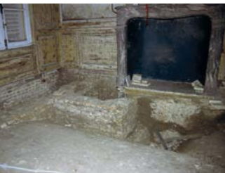
Funderingen opgegraven bij de restauratie van binnenruimten in een kasteel