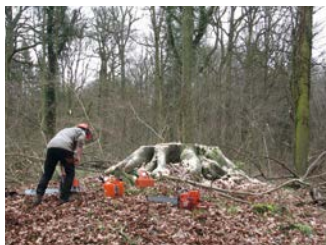
Het kappen van bomen met behoud van de stronk