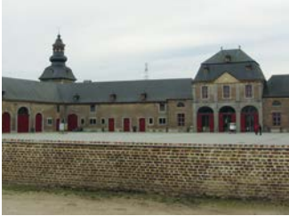
Een historisch gegroeide abdijsite

Ter info: volgens de Vlaamse regelgeving is het verboden om archeologische artefacten, archeologische sites en archeologische ensembles te ontsieren, te beschadigen of te vernielen. Dat heet het passief behoudsbeginsel. Iedereen die per toeval een archeologische vondst ontdekt, is verplicht om dat binnen de drie dagen te melden aan het agentschap Onroerend Erfgoed: www.onroerenderfgoed.be/nl/digitaal-vondstmeldingsformulier . Archeologen van het agentschap komen dan ter plaatse om de vondst te onderzoeken. Dit onderzoek is gratis.