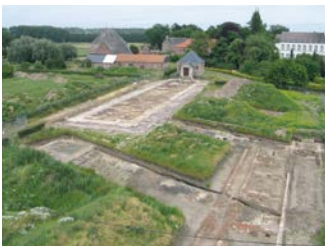
Archeologische resten aangetroffen bij een opgraving op een abdiydomein