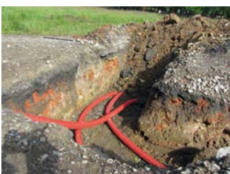
Een bodemingreep: het aanleggen van nutsleidingen