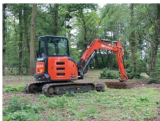
Tuin/parkaanlegwerken met ingreep in de bodem