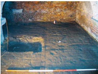
Opgraving in de kelder van een abdiydomein