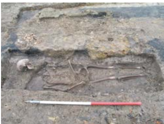
Resten van menselijke begraving aangetroffen bij een opgraving op een abdiydomein